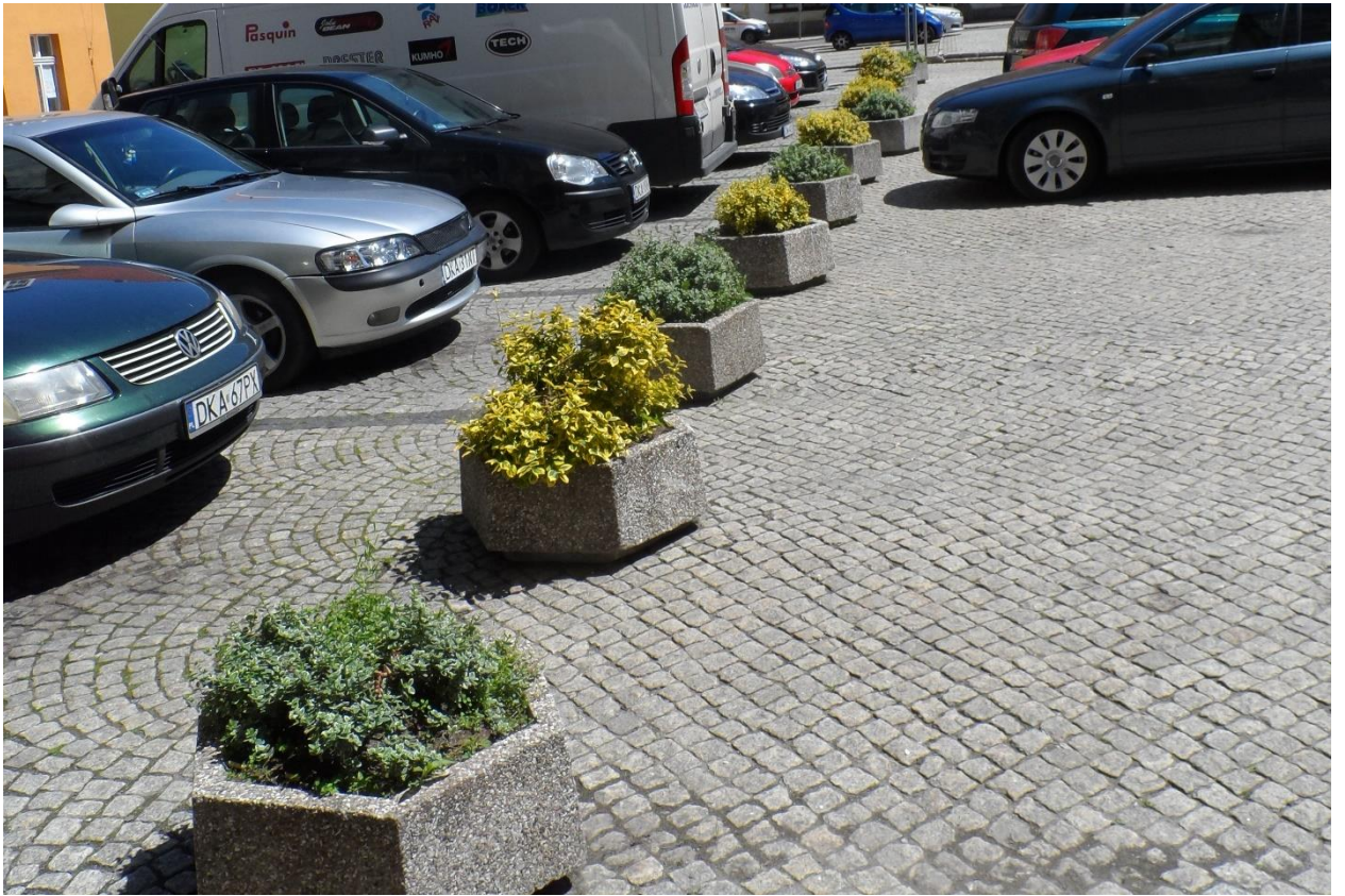
Klomb i gazony w rynku przed nowym zagospodarowaniem.