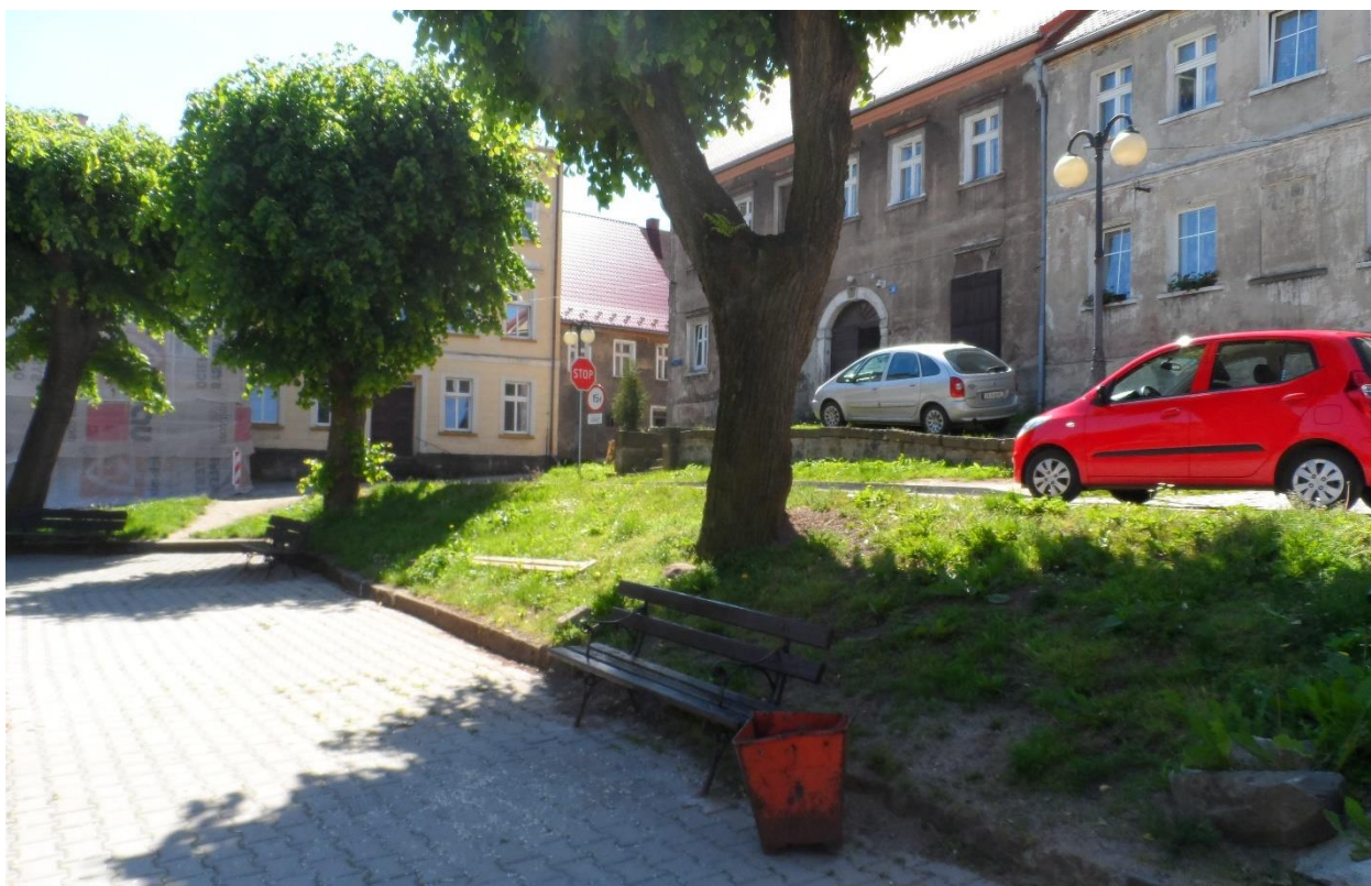
Klomb i skarpa w rynku przed zagospodarowaniem.