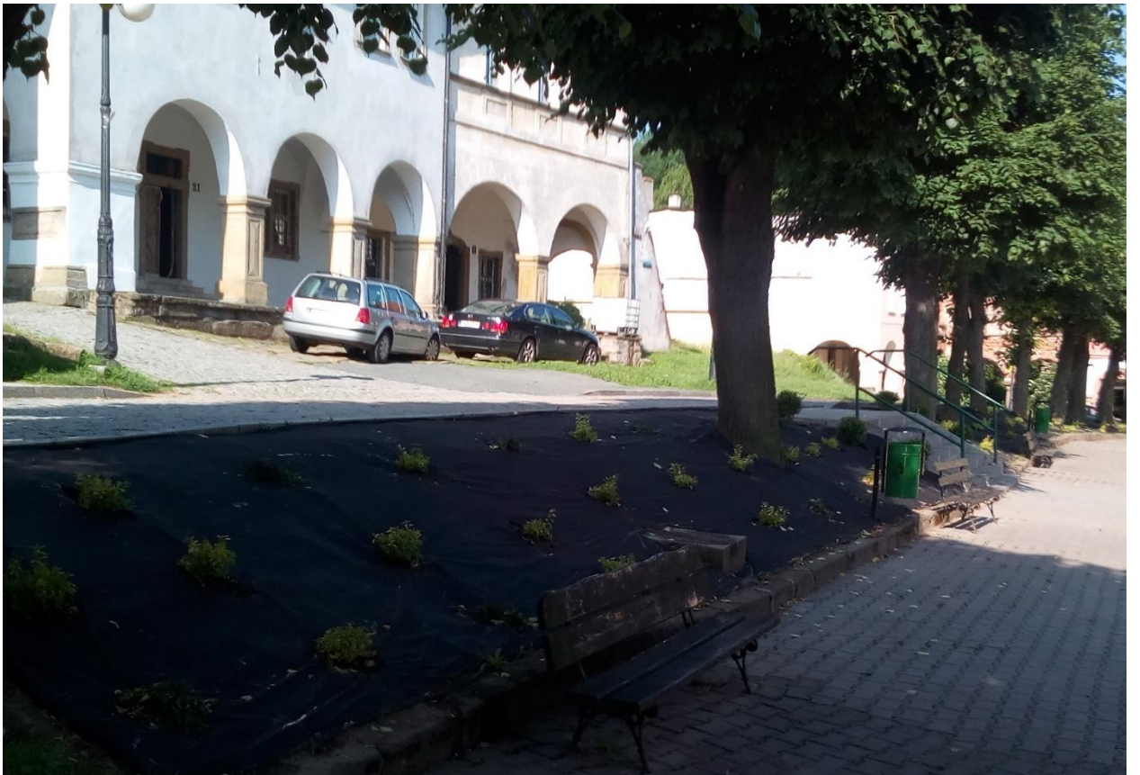
Klomb i skarpa w rynku po zagospodarowaniu.