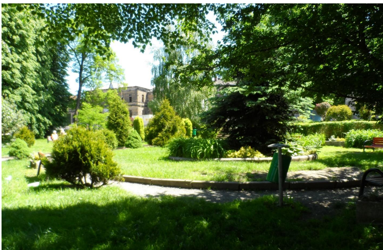
Park przy ul. Kombatantów przed wykonaniem zabiegów pielęgnacyjnych.