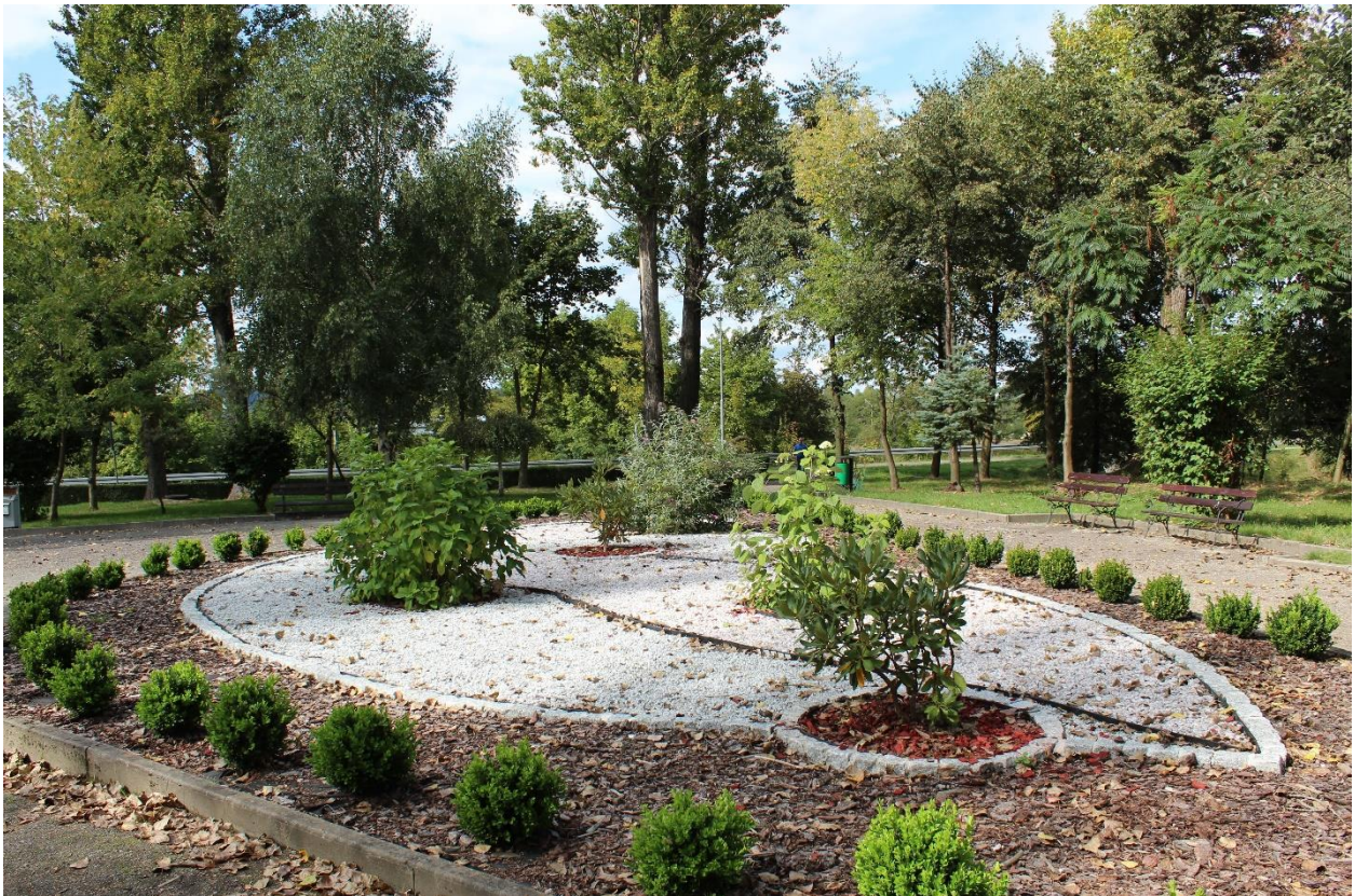
Klomb w parku przy ul. Przyjaciół Żołnierza po przebudowie