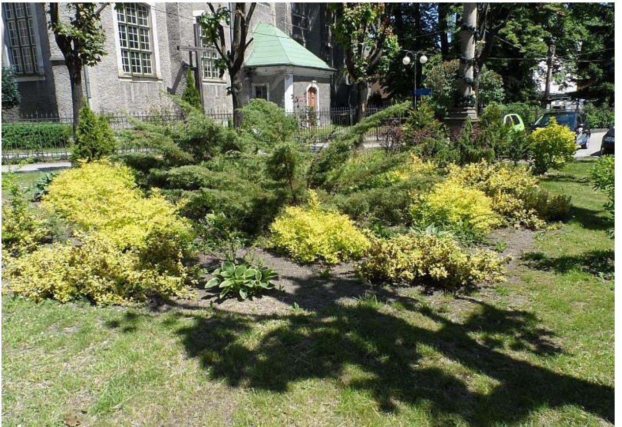
Kłomb przy Placu Jana Pawła II przed przebudową