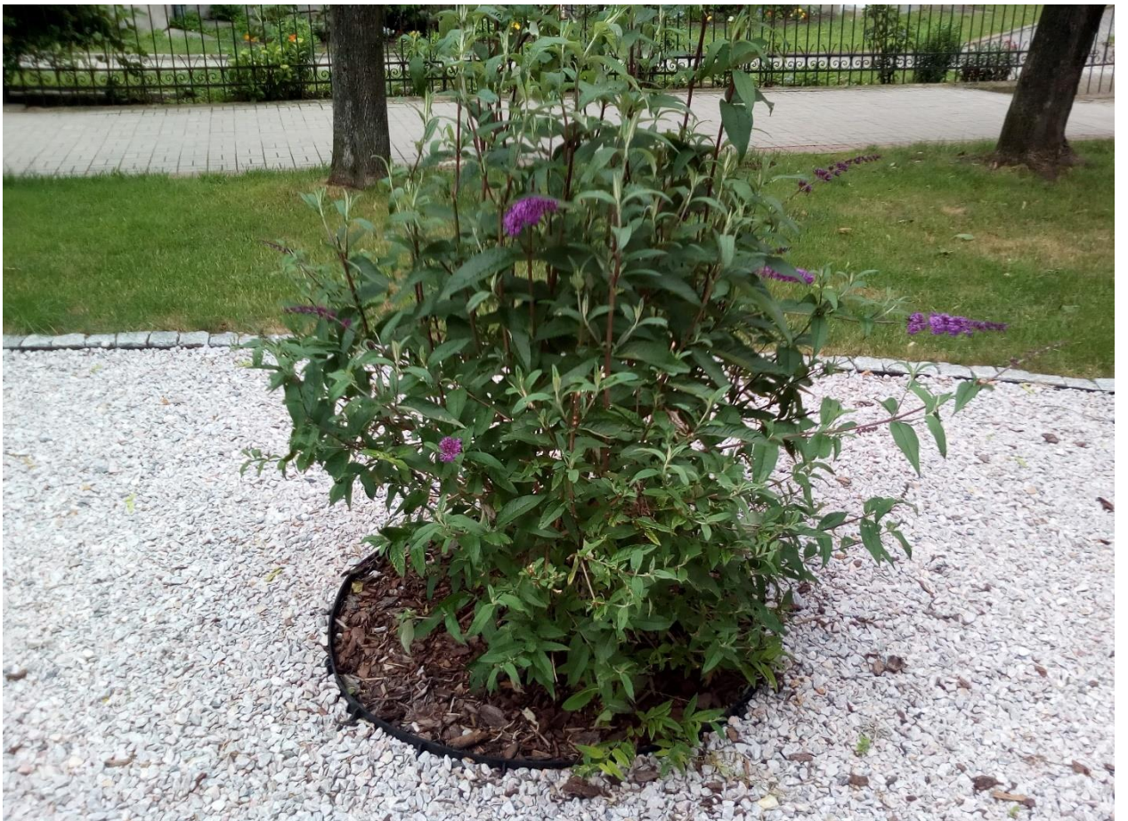
Klomb przy Placu Jana Pawła II po przebudowie