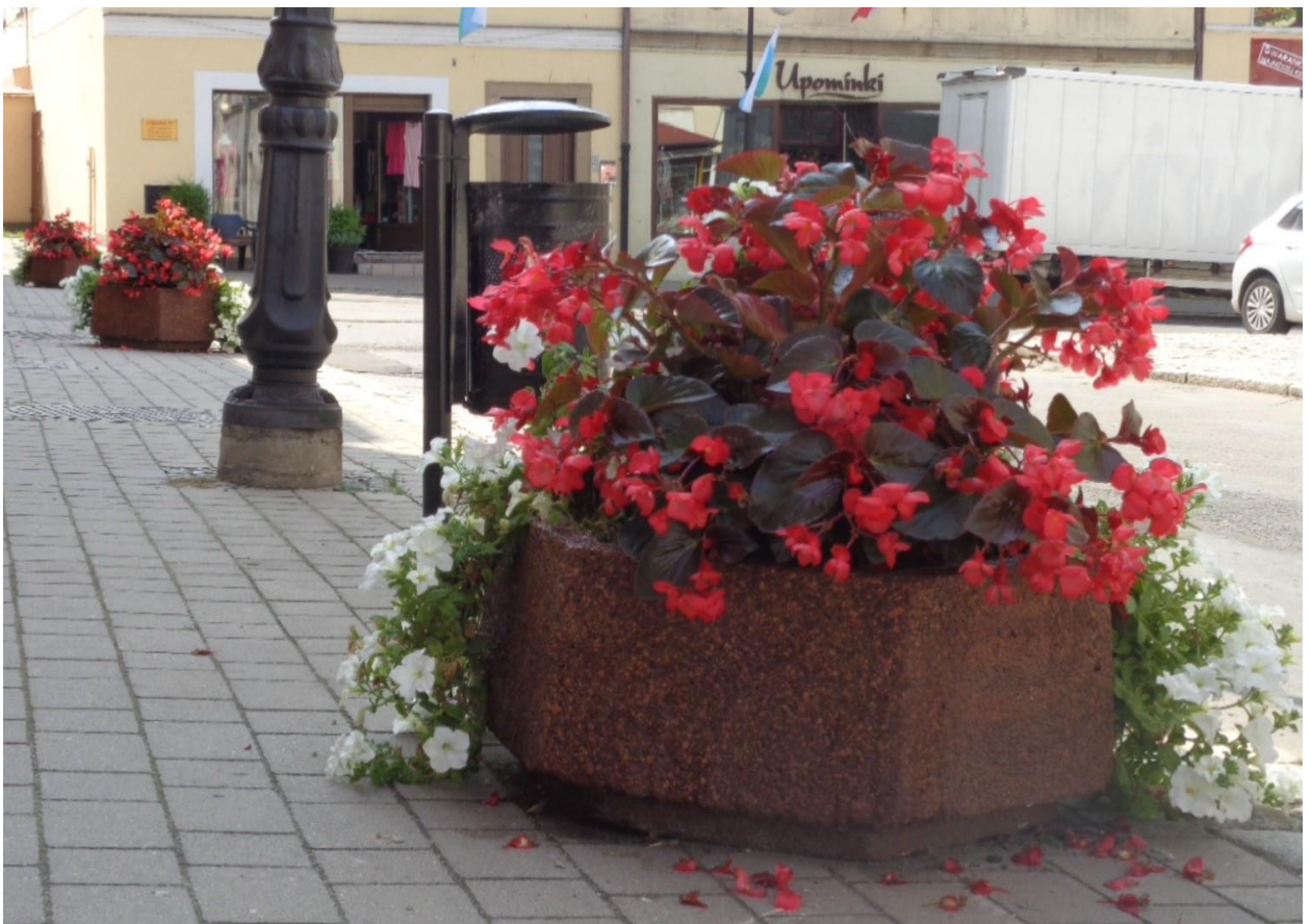
Klomb, kwietniki i gazony w rynku po nowym zagospodarowaniu.