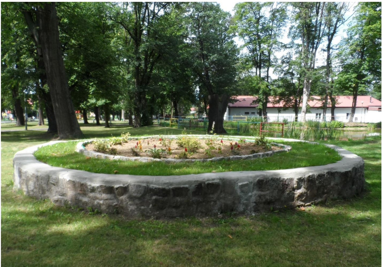
Klomb po zagospodarowaniu