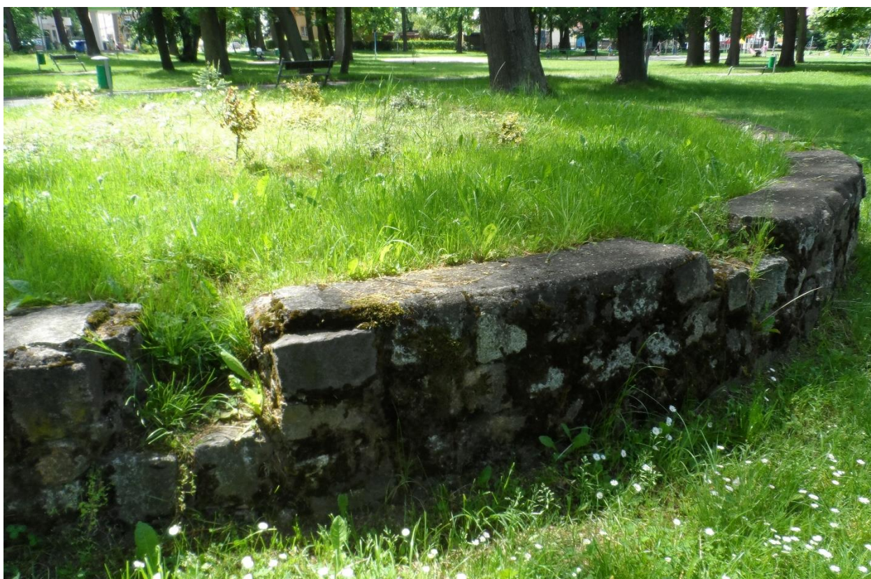
Klomb przed zagospodarowaniem