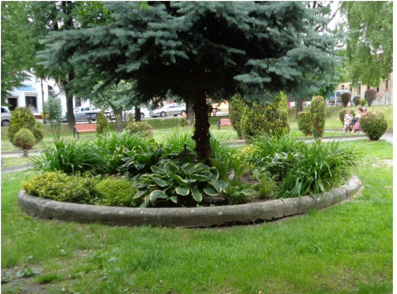
Park przy ul. Kombatantów po wykonaniu zabiegów pielęgnacyjnych.